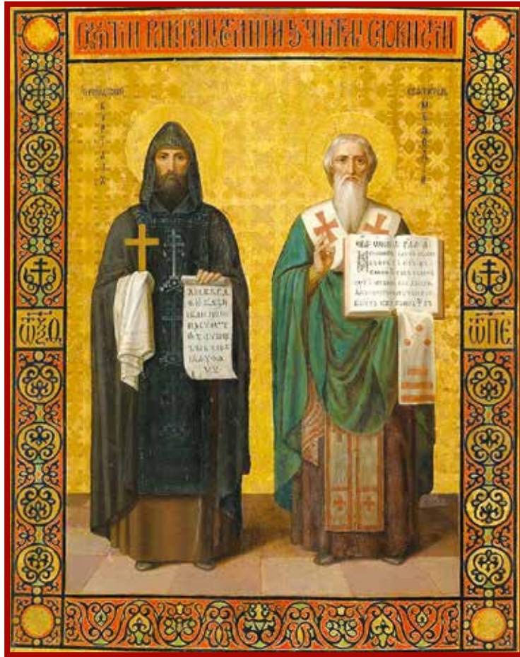
Святые равноапостольные Кирилл и Мефодий с азбукой

гробик дочери: «За что, Господи, за что?!» Славная была девчонка, маленькая, беленькая, улыбочивая, с косичками и веснушками.