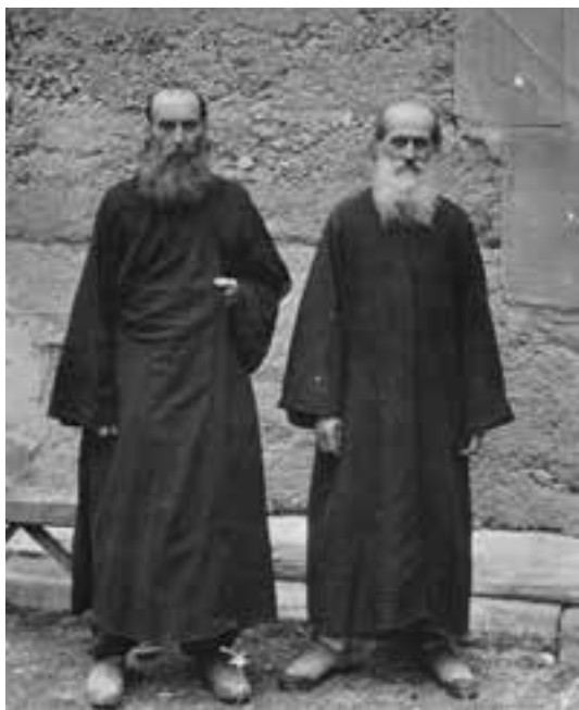
Преподобные Иоанн (Майсурадзе) и Георгий (Мхеидзе)

Мы попытались хотя бы частично, внешне описать житие одного из самых почитаемых грузинских духовидцев XX в., уже широко известного в среде верующих людей мира, — преподобноисповедника, юродивого старца Гавриила. Описание же его богатейшей духовной жизни простому смертному неподвластно, один лишь Господь ведаёт о ней.