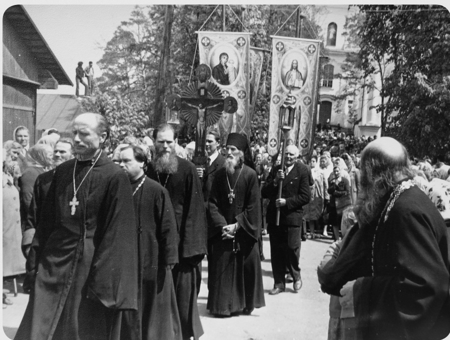
Праздник Жировицкой иконы Божией Матери. Крестный ход к Явленскому храму. 1960-е гг.