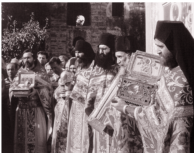
Пасхальный молебен в Свято-Пантелеимоновом монастыре