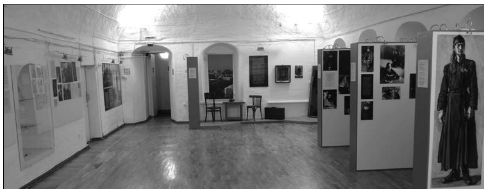
Ил. 2. Выставка «Тайные монашеские общины Высоко-Петровского монастыря, 1920–1950 гг.»