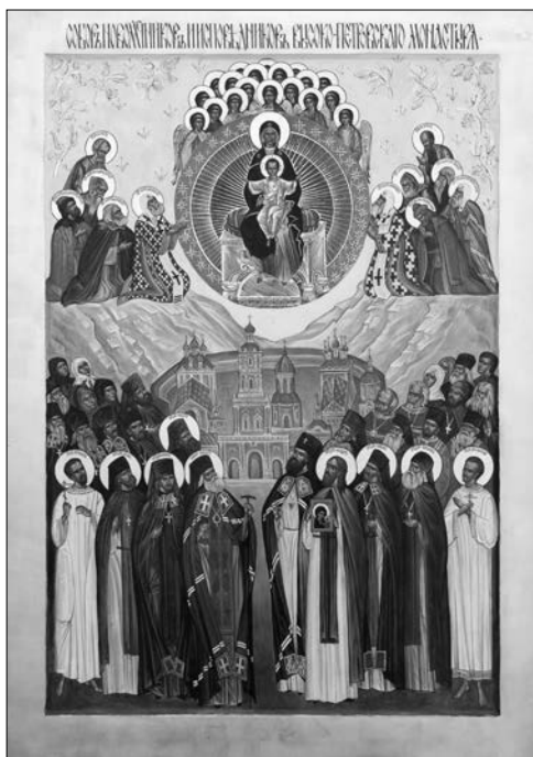
Ил. 1. Икона «Собор новомучеников и исповедников Высоко-Петровского монастыря» до 2020 г.