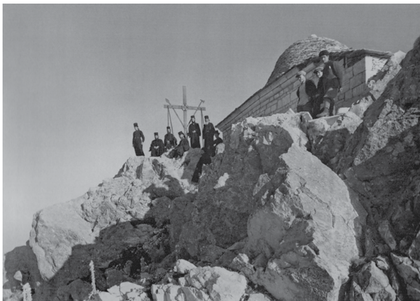
Вершина горы Афон