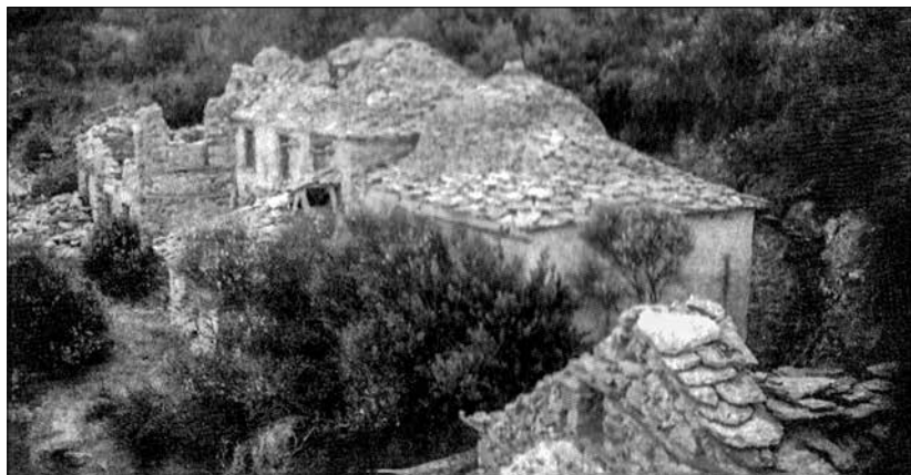
Келья Успения Пресвятой Богородицы, где подвизался отец Григорий