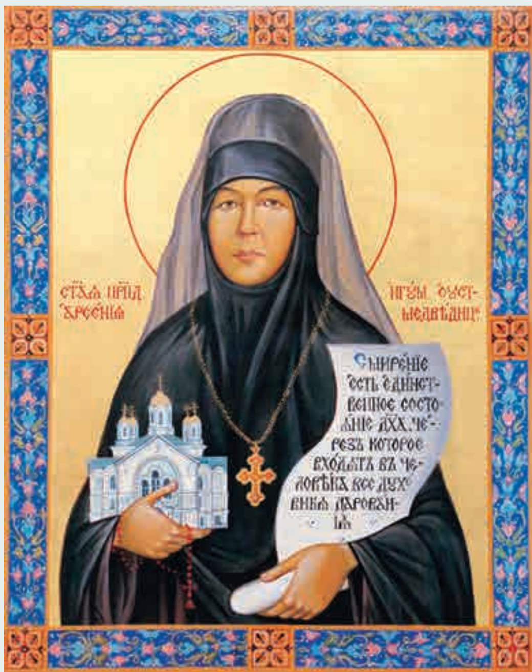
Преподобная Арсения, игуменья Усть-Медведицкая. Современная икона