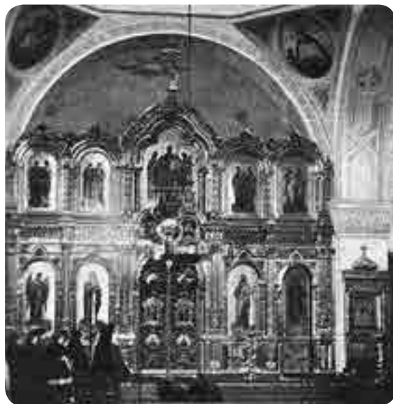
Иконостас собора во имя Казанской иконы Божией Матери