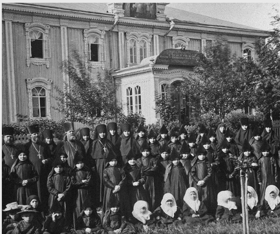
Церковно-приходская школа и приют при Серафимо-Дивеевском монастыре