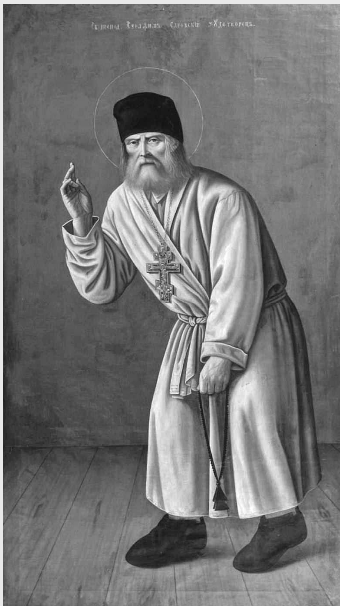
Преподобный Серафим Саровский